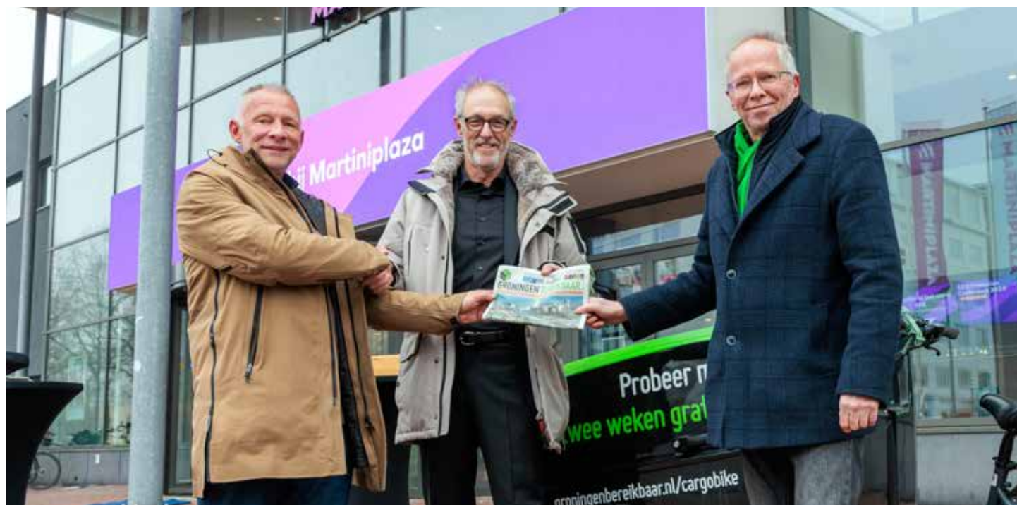
Groningen Bereikbaar bezocht alle bedrijven en instellingen in de stad met informatie over Operatie Ring Zuid.

Al ruim tien jaar werken bedrijven en instellingen in de stad samen met de overheden, in de samenwerkingsorganisatie Groningen Bereikbaar. Tijdens een Captains Meeting werden de organisaties in Groningen al vroegtijdig geïnformeerd. De mobiliteitsadviseurs van Groningen Bereikbaar hadden veelvuldig contact met bedrijven en instellingen, zodat deze organisaties zelf ook maatregelen konden nemen op het gebied van mobiliteit en bereikbaarheid. Zo paste zowel het UMCG als het Martini Ziekenhuis het rooster van patiënten aan, zodat patiënten van buiten de stad niet in de spits hoefden te reizen. Certe zette fietskoeriers in voor het transport van onder andere bloedmonsters. En Bidfood gebruikte een bakfiets voor levering van goederen aan de horeca.