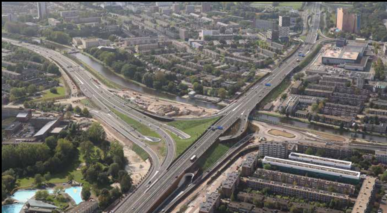
Het nieuwe Julianaplein.